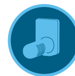
Sensor Freeze-Clik Página 152