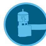
Sensor Mini-Clik Página 145