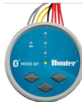
NODE-BT Diámetro: 8,9 cm Altura: 8,3 cm

La marca nominativa y logotipos de Bluetooth® son marcas registradas propiedad de Bluetooth SIG, Inc. y cualquier uso de tales marcas por Hunter Industries Corporation se hace bajo licencia. iOS es una marca comercial o marca registrada de Cisco en EE. UU. y otros países, y se utiliza bajo licencia. Android es una marca registrada de Google LLC.